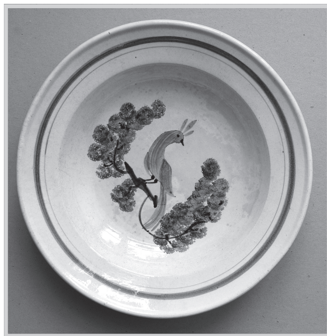
Fabryka Fajansu w Jedlni (Muzeum im. J. Malczewskiego w Radomiu)