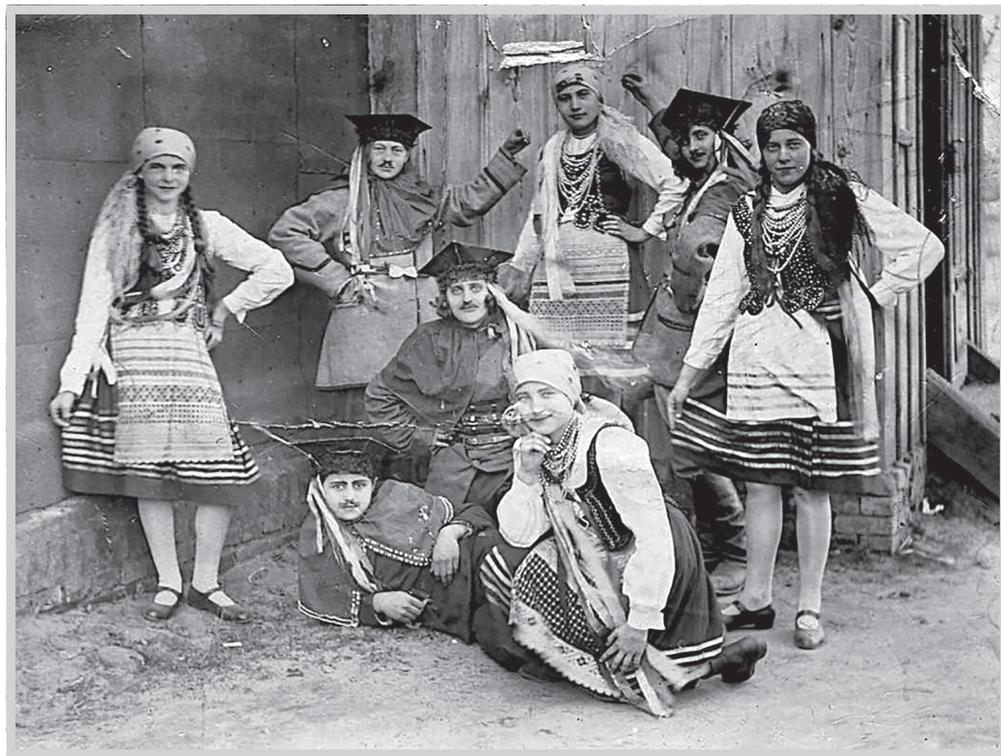
Młodzież przed Domem Parafialnym w Jedlni – przygotowania do przedstawienia

Wybrane teksty zostały podzielone na kilka rozdziałów ze względu na swoją tematykę, charakter i formę, do każdego z nich zostały przypisane zdjęcia, niektóre o dużej wartości historycznej i dokumentacyjnej. Dzięki temu możemy mieć pewność, że udało się je uratować od zapomnienia, nie ulegną zniszczeniu. W opublikowanych materiałach wspomnieniowych pojawiają się nazwiska i opisy zdarzeń z niedległej przeszłości: mieszkańców wsi, budowniczych kościoła czy założycieli Banku Spółdzielczego, członków stowarzyszeń działających w Jedlni w okresie międzywojennym, księży pełniących posługę, nauczycieli czy wojskowych – nawet jeśli ich osiągnięcia czy czyny z naszej perspektywy, ludzi mających nieskrępowany i natychmiastowy do-