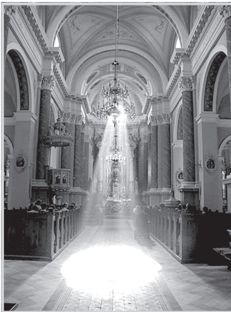
Wnętrze kościoła pod wezwaniem św. Mikołaja w Jedlni

W oparciu o dokumenty kościelne, biskupi polscy, podczas obrad 313. zebrania plenarnego Konferencji Episkopatu Polski (Łowicz 20–21.06.2001 r.) dokonali zmiany i przyjęli katechizmowy zapis pięciu przykazań kościelnych. Watykańska Kongregacja Nauki Wiary na prośbę polskich biskupów zatwierdziła ich treść. Zaakceptowane przez Watykan przykazania kościelne w nowym sformułowaniu brzmią następująco: