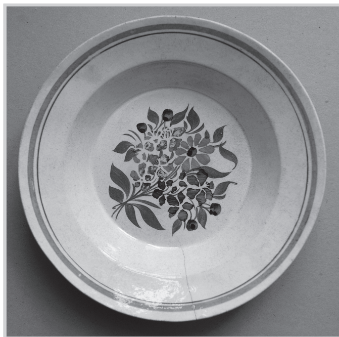
Fabryka Fajansu w Jedlni (Muzeum im. J. Malczewskiego w Radomiu)

W założeniach publikacja miała być kompendium wiedzy o historii Jedlni i regionie zamykającym się w stu dwudziestu stronach. Miały do niej wejść wybrane teksty różnych autorów „Naszej Jedlni” opublikowane w latach 2007–2019, o tematyce historycznej, wspomnieniowej, uzupełnione wywiadami, przedrukami z prasy regionalnej i zdjęciami o wartości dokumentalnej oraz fragmenty folderów i wydawnictw okolicznościowych. Mimo niezwykle rygorystycznych zasad wyboru, szybko okazało się, że książka nie tylko przekroczy zakładaną liczbę stron, ale nawet ją podwoi. To były bardzo trudne decyzje – które teksty i w jakiej objętości zakwalifikować do druku. Każdy aspekt życia wsi na przestrzeni wieków wydawał się bardzo ważny, wart odnotowania chociażby małą wzmianką, a przecież także współcześnie dokonało się w najbliższej okolicy wiele zmian wartych udokumentowania. Z tej racji muszę zwrócić się do autorów i czy-