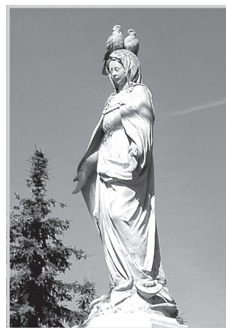
Figura Maryi Panny Niepokalanej, z 1909 r., stojąca przy kościele w Jedlni